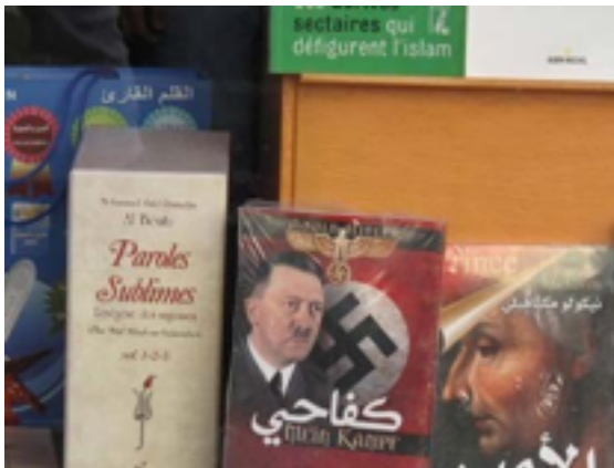
Boek tentoongesteld in een etalage in Brussel (17-07-2014)