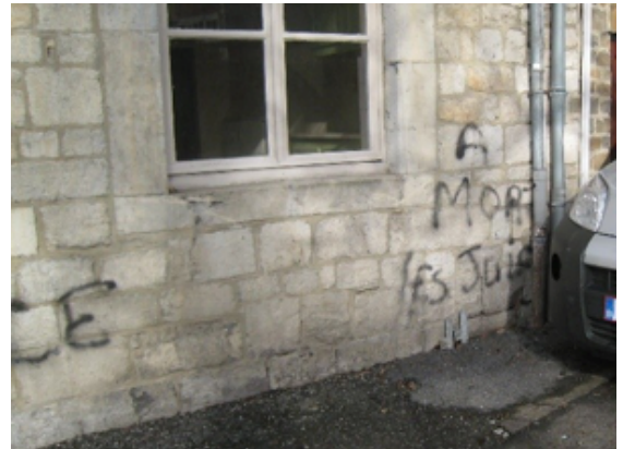
Marche-en-Famenne (b), 31-08-2014